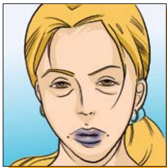
Посинение губ и кожных покровов