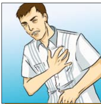
Боль в груди